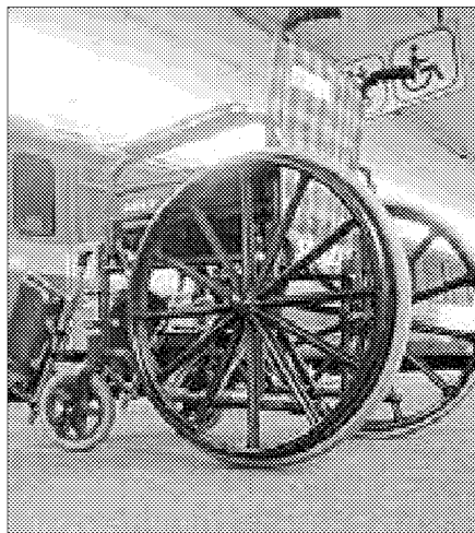
Botta e risposta Sulle cure estive per i disabili