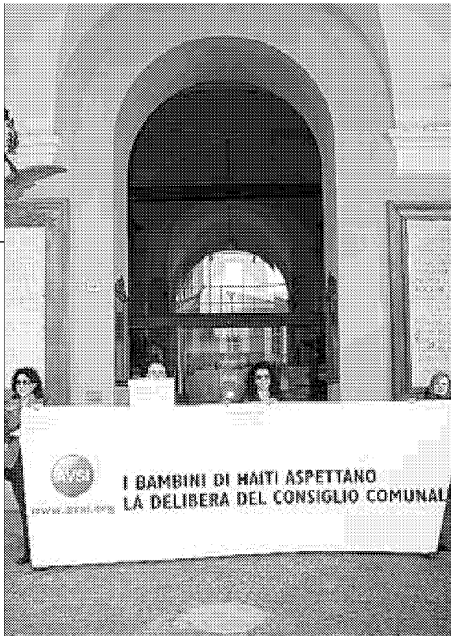
Gli operatori dell'Avsi con i cartelli sollecitano il consiglio comunale per una soluzione della vicenda della sede

CESENA - Oggi presso la sede temporanea, ossia gli spazi dov'è ubicata l'Associazione Benigno Zaccagnini che ha offerto loro una stanza della sede di Corso Sozzi, la Fondazione Avsi incontra il sindaco Paolo Lucchi. "Una visita di amicizia - commenta Lucchi - per capire come si sono sistemati e come procede il loro lavoro". Una verifica de visu delle condizioni, non certo facili, a cui gli operatori (alcuni dei quali sono ospiti in abitazioni private) si sono adeguati dopo che hanno dovuto lasciare la sede appena inaugurata nel complesso Sacra Famiglia, chiusa per irregolarità edilizie. I 20 operatori dell'Avsi sono in attesa, e pare che tra un giorno o due l'attesa sarà terminata, di occupare l'appartamento di via Martiri della Libertà che fino a qualche tempo accoglieva l'Urbanistica comunale. Si tratta di 200 metri quadri, messi a disposizione del Comune, che consentirà uno spazio maggiormente adeguato aspettando (i tempi potrebbe allungarsi) la soluzione del cantiere Sacra Famiglia.