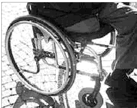
Disabilità Se ne parla oggi nella parrocchia di Santa Rita

sociale, sanitaria e sociosanitaria, svolta esclusivamente a titolo gratuito, della ricerca scientifica, della formazione, della beneficenza, della tutela, anche legale, dei diritti civili a favore di persone svantaggiate in situazioni di disabilità intellettiva e relazionale e delle loro famiglie, affinché sia garantito ai disabili il diritto inalienabile ad una vita libera e tutelata, il più possibile indipendente nel rispetto della propria dignità.