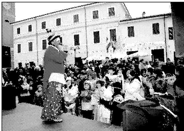
Il carnevale a Montiano

MONTIANO. «Siamo soddisfatti dell'esito della 10 a edizione del carnevale». Domenica scorsa si è svolto a Montiano, in piazza Maggiore, il "10° carnevale dei bambini". Come già avvenuto gli scorsi anni, un carro raffigurante Giano bifronte (simbolo di Montiano) naturalmente mascherato ha effettuato alcuni giri nel centro del paese. Al termine dei giri, in piazza Maggiore, erano pronti ad attendere le mascherine due comici e una truccatrice che hanno coinvolto la maggior parte dei presenti fino all'imbrunire.