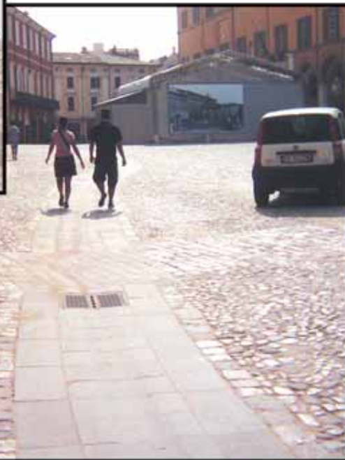
Foto 2 Percorso pedonale accessibile alle carrozzine in Piazza del Popolo a Cesena