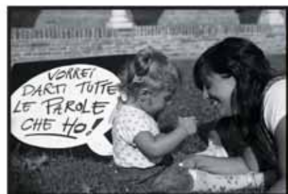
Alcuni scatti della mostra fotografica "Le parole per dirlo".