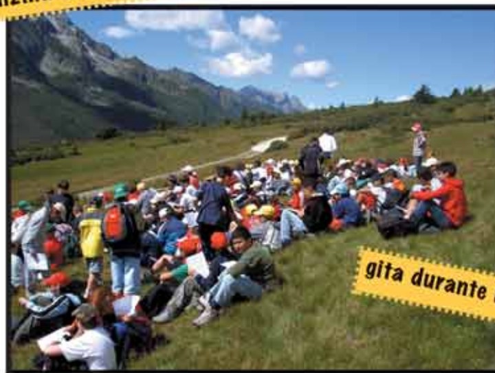
gita durante la vacanza al passo Tonale nel 2005