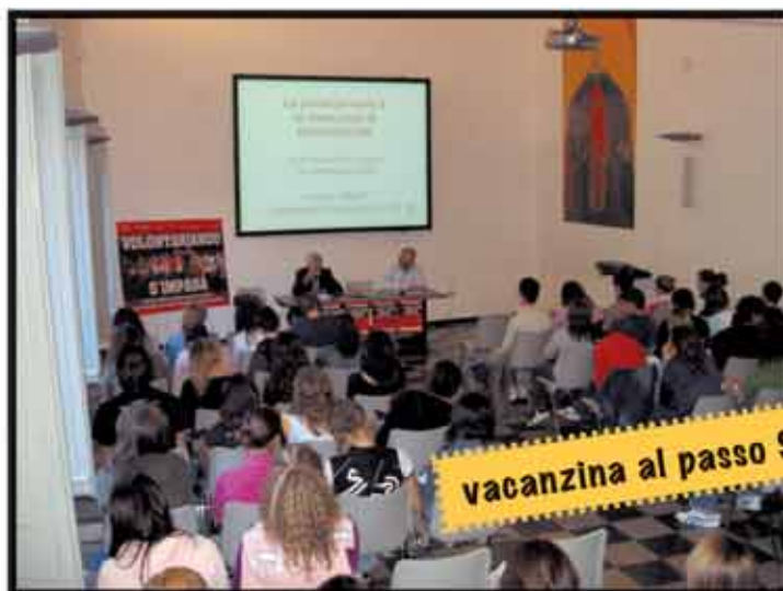
vacanzina al passo S. Pellegrino, nel 2006