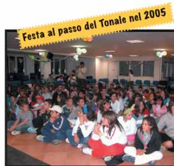
Festa al passo del Tonale nel 2005