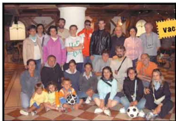
vacanzina al passo S. Pellegrino, nel 2006