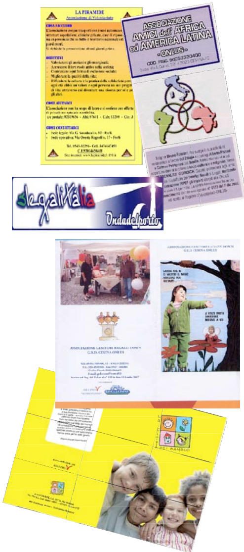
Alcuni esempi di brochure realizzate nell'anno 2007 per le associazioni di nuova costituzione