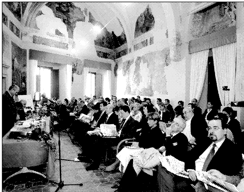
Le "Giornate di Bertinoro" si preparano a celebrare il decennale

Per informazioni e iscrizioni contattare la segreteria Aiccon, telefono 0543.62327, oppure ecofo.aiccon@unibo.it , o visitare il sito www.aiccon.it .