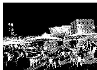
Successo di presenze per la Festa Artusiana 2010