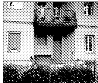
Il Csm di via Don Minzoni

All'incontro si è ribadito con forza che non si può imporre una riorganizzazione tanto profonda del Centro di salute mentale, anche se si avvarrà di strumenti nobili come l'apertura nelle 24 ore, senza una condivisione sui cambiamenti e soprattutto senza il minimo coinvolgimento attivo di utenti, familiari ed operatori. «Si deve avere nei fatti, come primo obiettivo, la massima attenzione a non pro-