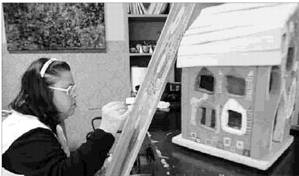
Il prezioso lavoro svolto all'Enaip che ha portato alla realizzazione delle note "casine"

Quest'anno la festa di fine anno dell'Enaip vuole essere l'occasione per condividere con la cittadinanza le grandi doti artistiche che hanno nella pittura, nella scrittura ed anche nella musica, alcuni ragazzi del centro di formazione lavoro e del centro di terapia occupazionale "laboratorio juta" dell'Enaip di Cesena animeranno la serata ognuno con la propria arte. In questa occasione avverrà la prima proiezione ufficiale del documentario "casine" e l'evento verrà trasmesso in diretta audio tramite la web-radio radioline dalla postazione all'interno del laboratorio mostra casine, grazie al lavoro dei ragazzi del polo informatico del centro di terapia occupazionale "laboratorio juta". I ragazzi che frequentano i centri Enaip producono casine di legno colorate, borse di pelle e juta, e vasi in ceramica deco-