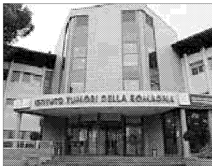
Tutti a tavola contro il cancro