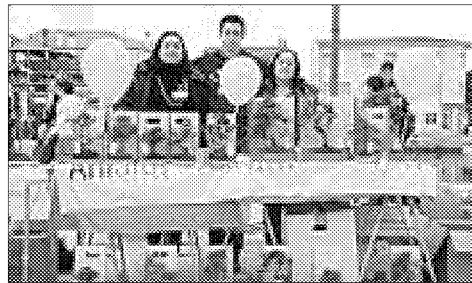
I volontari dell'associazione "Telemaco"

CESENATICO - (n.b.) Raccolti oltre 1.000 euro da Telemaco per l'Anlaids. I volontari dell'associazione giovanile il 2, 3 e 4 aprile, si sono fatti portatori del messaggio dell'Anlaids, ente che sostiene la ricerca contro l'Aids, mediante un banchetto per la raccolta fondi e la vendita dei bonsai. Nonostante il meteo infausto, i ragazzi sono riusciti a raccogliere oltre mille euro. La raccolta fondi continua: basta contattare i numeri 333-6506407 e 333-3743556, potendo altresì acquistare un bonsai.