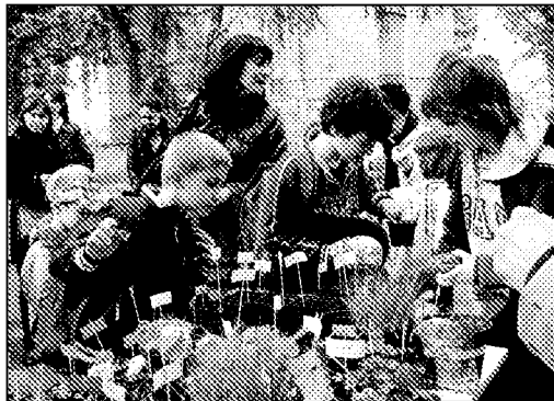
Alcuni alunni della "Nave" con le piantine da loro curate

zio Quaresima, sono state seminate piantine ufficiali che i bambini hanno innaffiato e curato e,