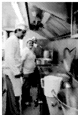
MENSA E' piaciuta la cucina romagnola

Sabato 17 e domenica 18 120 bambini aquilani verranno a Forlì e saranno ospitati in casa dai loro coetanei