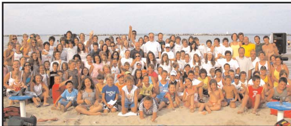
Società dell'Allegria Volontari del servizio civile e responsabili della Società dell'Allegria ai centri estivi a Cesenatico