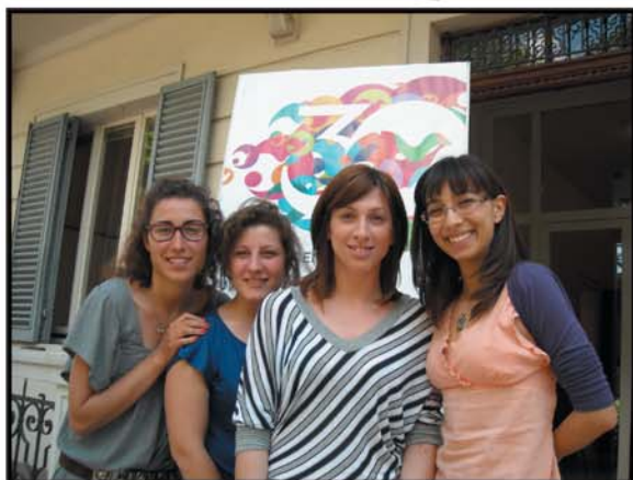
Volontari e Meeting Le quattro volontarie al Meeting per l'amicizia fra i Popoli di Rimini