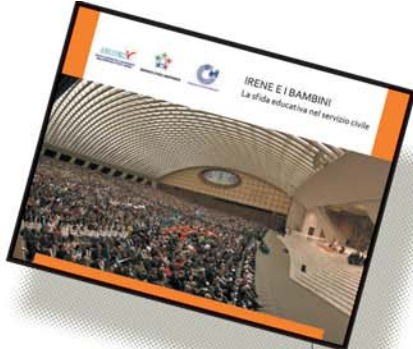
La copertina del libro che è stato finanziato da Ass.I.Pro.V. con il patrocinio dell'Ufficio Nazionale per il Servizio Civile.

Un libro sul servizio civile volontario, ma soprattutto uno strumento formativo rivolto ai ragazzi, che vogliono intraprendere questa esperienza. Filo conduttore della pubblicazione sono, infatti, proprio le interviste e le storie di vita dei giovani volontari, che testimoniano, in ambiti differenti, la stessa passione nel mettersi al servizio del bene comune. Non mancano interventi dei responsabili e degli operatori locali di progetto, chiamati a sostenere i giovani in questo percorso di educazione al lavoro e alla gratuità.