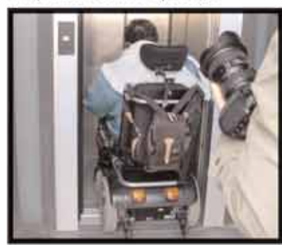
Foto 3 Ascensore di Palazzo del Ridotto: poco agevole per le carrozzine elettriche

Neppure i luoghi di cultura sono privi di ostacoli: è possibile ad esempio accedere alla Biblioteca Malatestiana, in quanto l'entrata è dotata di una rampa, ma è complicato uscirne a causa di uno scalino interno in prossimità dell'uscita. Liviana, inoltre, incontra delle difficoltà ad accedere a Palazzo del Ridotto a causa delle dimensioni troppo ristrette dell'ascensore ed è costretta a fare un po' di manovre con la sua carrozzina elettrica per poterne usufruire. Per lei, quindi, diventa problematico partecipare alle iniziative ospitate in questa location (foto 3).