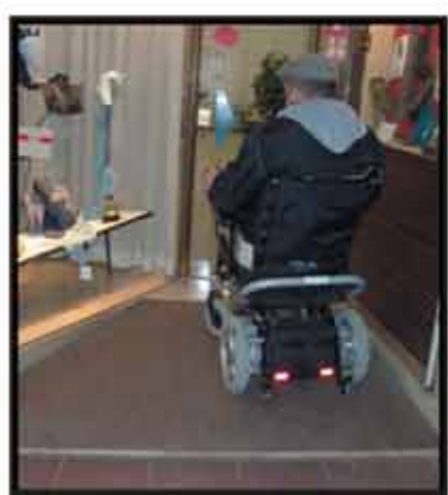
Foto 2 Rampa di accesso ad un negozio del centro: un ottimo esempio

Molti esercizi commerciali presentano dei gradini all'entrata o al loro interno e ciò impedisce alle persone in sedia a rotelle di poter accedere a tali locali o di potersi liberamente muovere al loro interno. Altri, ben pochi purtroppo, hanno dotato l'entrata di una rampa per consentire a tutti l'accesso (foto 2).