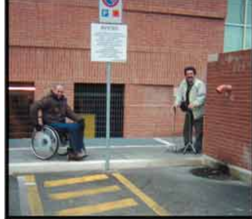
Foto 4 Parcheggio per persone disabili senza scivolo presso il centro commerciale Montefiore

Oppure ingombranti rastrelliere per biciclette nei pressi dei parcheggi per persone disabili (foto 5).