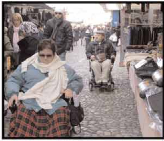
Foto 1 Piazza del Popolo e la sua pavimentazione non accessibile