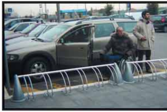
Foto 5 Rastrelliere porta bici in prossimità di un parcheggio per persone con disabilità

Oppure ingombranti rastrelliere per biciclette nei pressi dei parcheggi per persone disabili (foto 5).