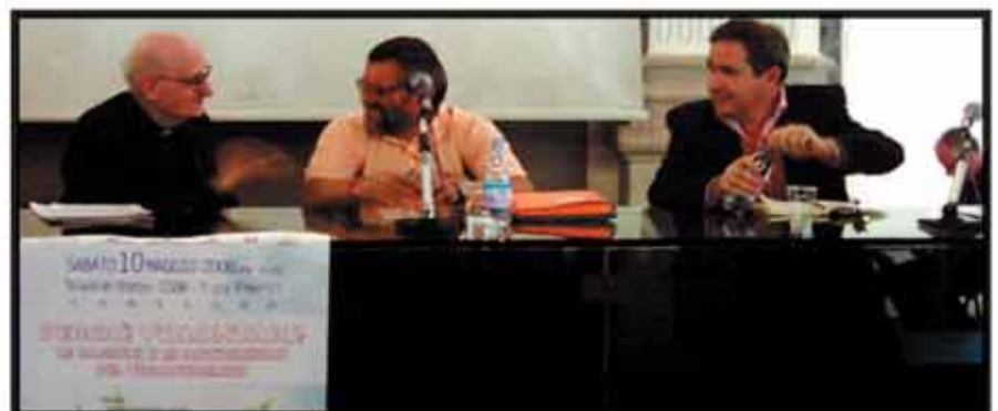
Un altro momento del convegno con la presenza dei relatori.