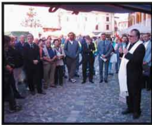
Benedizione degli automezzi per il trasporto persone disabili