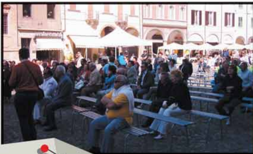
In attesa del concerto